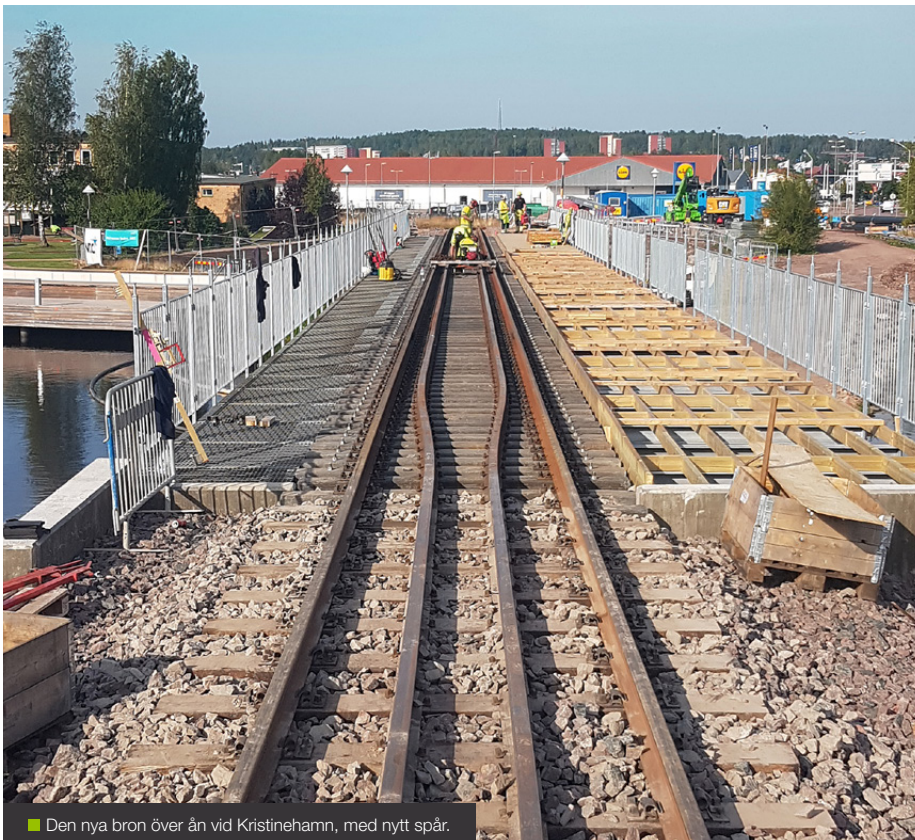
■ Den nya bron över ån vid Kristinehamn, med nytt spår.