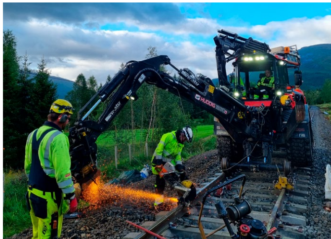
■ Detta är bilder som visar när STG svetsar och neutraliserar i samband med spårrenovering mellan Svenningdal och Mosjøen i Norge. En sträcka som är en del av Nordlandsbanan.

– Vi uppskattar verkligen samarbetet med dem. Vi har en jättebra relation. Den personal vi jobbar med är trevliga och lätta att jobba med. Vi känner varandra. Vi får också långa uppdrag så grabbarna kan planera för längre perioder, menar Linn Braun.