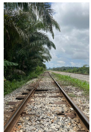
■ Befintligt trafikerat smalspår parallellt med nybyggt spår på sträckan Takoradi-Manso.

Han berättar att det är en hel del grundläggande förberedelser som skall göras så att personalen är redo att resa dit när det i vinter blir klarteckent för det.