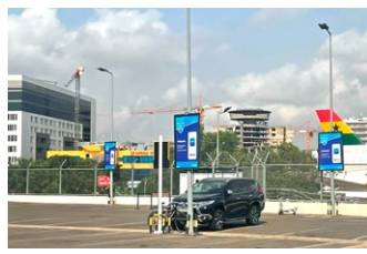
■ En stadsvy över Accra i Ghana.

Nu inleds en period av projektplanering. Det administrativa arbetet inleds efter semestrarna.