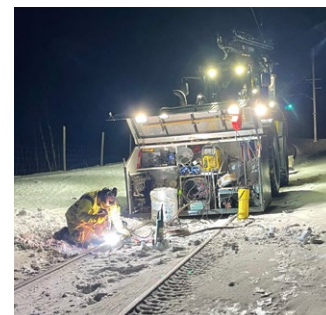
■ STG-personal utför servicearbete på en av landets nordligaste järnvägssträckor.

Men även om det inte snöat lika mycket denna vinter så har STG varit redo med en Huddig-maskin med förare. Samtidigt har maskinföraren funnits redo för hantlangning och materialtransporter till STG-medarbetare på bansidan och för servicearbete. Ett bra exempel på när personal från STGs olika affärsområden kan samarbeta.