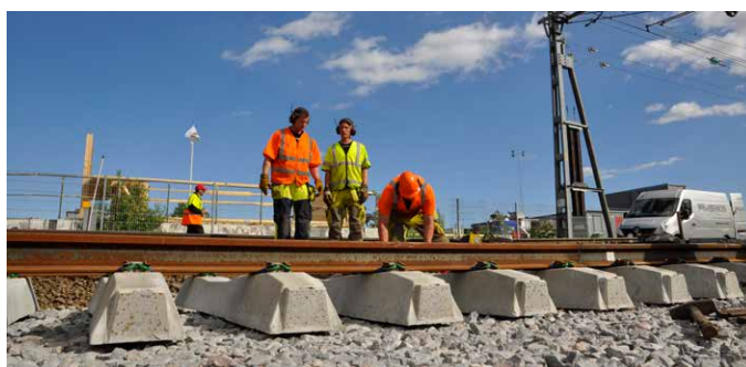
Utveckling, ökad närvaro och engagemang är viktiga nyckelord för affärsområde Ban.

• Våren 2017 blir en period för utbildning av medarbetarna.