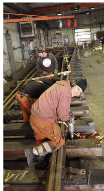
Tillverkning av växlar i STGs vinteranläggning.

Dessutom har vi sålt två växlar direkt som rena produkter till Infranord!