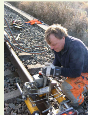
■ Trafikverket har ny beställt en ny omgång DEF-sliperbyten.

En annan viktig utbildningsdel gällde utbildning i el- och trafik-säkerhet.