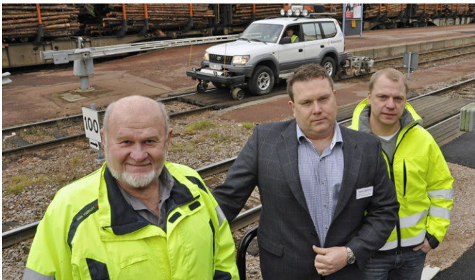
■ Dalaupppfinningen som revolutionerar arbetet med att besiktiga järnvägsspår.

Raildocs uppfinning har fått ett positivt mottagande inom branschen vilket kan leda till arbetstillfällena i Dalarna. För STG innebär det i framtiden arbetstillfällena då besiktningsfordonet skall bemannas av kompetent personal.