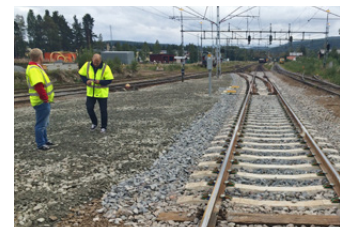
■ RWS 1435 på plats i Älvsbyn för spårväxelsbytte.

– Vi jobbade oerhört bra tillsammans. Här var vi två företag som verkligen talade samma språk. Det ger också bra förutsättningar inför eventuella kommande uppdrag.