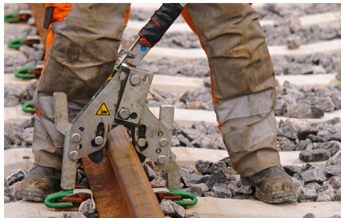
■ STG-koncernen är nu redo för totalentreprenader.