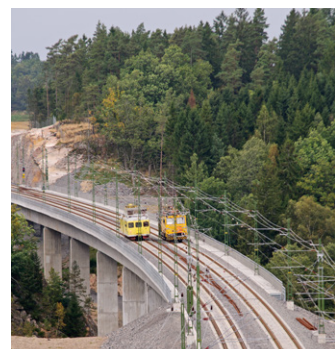
■ STGs utbildning gav resultat direkt.

hög kvalitet och det ser dessutom ut som att de kommer att ge bra avkastning. Mycket tack vare vinterns utbildning. I synnerhet gäller detta medarbetarna inom dotterbolaget RWS 1435 där flera visat prov på god handlingskraft, säger Tomas Sjöblom, ansvarig för STGs affärsutveckling.